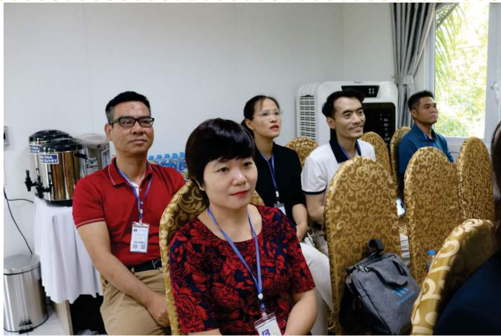
CEO của Công ty TNHH Y dược Kinh Đô, Công ty TNHH Grow Green tham dự Hội thảo