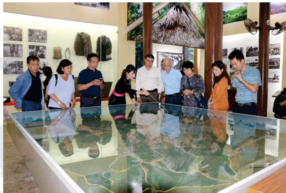
Đoàn Viện Y học bản địa nghe giới thiệu về quy mô an toàn khu ATK Định Hóa cũng như chiến dịch tác chiến Đông Xuân 1953-1954 và mở chiến dịch Điện Biên Phủ huyền thoại tại khu di tích lán Tín Keo, Định Hóa, Thái Nguyên