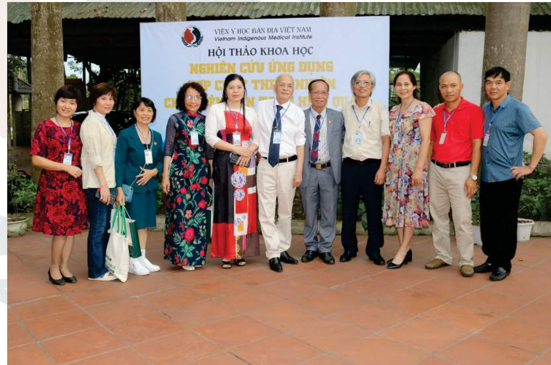
Kỷ yếu Hội thảo khoa học “ Nghiên cứu ứng dụng hợp chất thiên nhiên chữa bệnh an toàn hiệu quả” tại Viện Y học bản địa Việt Nam, Thái Nguyên, 12-13/5/2023